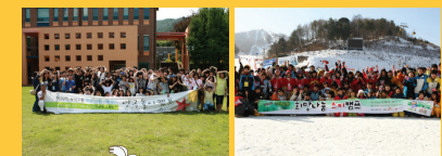
방학 중 여름 & 겨울 캠프