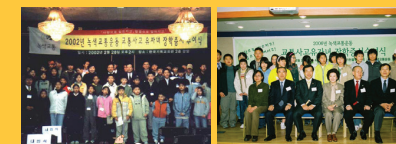
분기별 장학금 지급